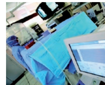
L'examen dure 1 heure en moyenne.

L'IRM se fonde sur le principe de la résonance magnétique des protons du corps humain au sein d'un champ électromagnétique, créé par un aimant géant en forme de tunnel au sein duquel le patient est placé.