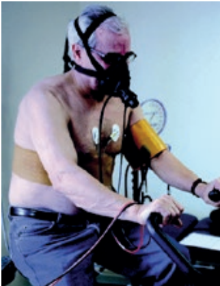
L'examen dure une demi heure à trois quarts d'heure.

C'est un ECG enregistré à l'aide d'électrodes placées à l'intérieur du cœur. Cette méthode est réservée à l'exploration de certains troubles du rythme complexes, dont elle permet de mieux comprendre l'origine. Il nécessite une anesthésie locale.