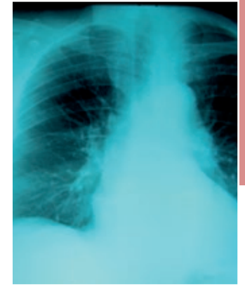
L'examen dure 5 à 10 minutes, y compris le temps de se déshabiller.

Il faut éviter de faire une radiographie du thorax en cas de grossesse. Dans certaines situations exceptionnelles, une radiographie du thorax peut être prise « au lit du malade ».