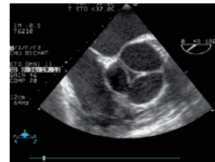
L'examen dure 15 à 45 minutes selon les conditions de sa réalisation. La sonde n'est pas laissée plus de 10 minutes dans le tube digestif.

Être à jeun depuis 6 heures et dans l'heure qui suit l'examen. Les médicaments sont normalement pris. Un spray d'anesthésique est pulvérisé dans l'arrière-gorge. Un cale-dent maintient la bouche ouverte. Parfois, une perfusion est mise en place dans une veine du bras pour injecter du sérum physiologique (eau proche de la composition des liquides de l'organisme) quand on recherche un trajet inhabituel du sang à l'intérieur du cœur. Des douleurs de l'arrière-gorge, ressemblant à une angine peuvent persister quelques heures.