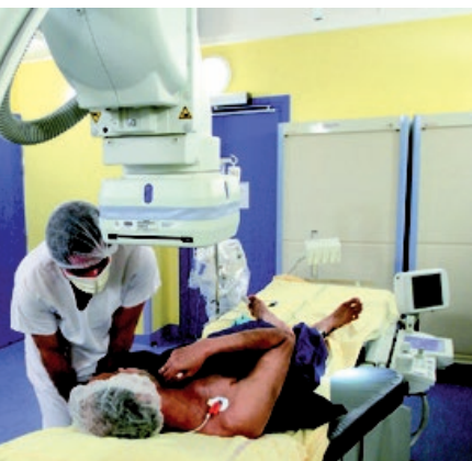
L'examen dure 1 heure environ.

Mieux encore, les stents actuels sont « enrobés » de médicament qui évite la resténose de l'artère.