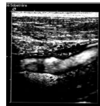
L'examen dure quelques minutes.